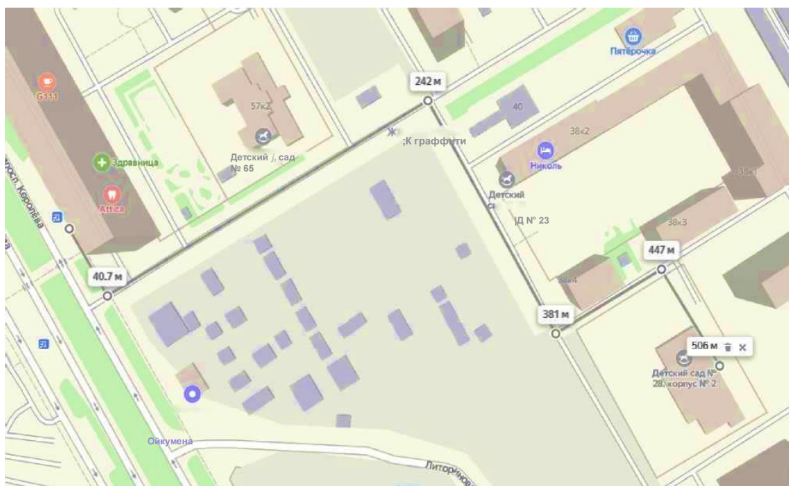
Схема движения к объекту от остановки общественного транспорта «Прспект Королева, 57»

Осуществление образовательной деятельности по образовательной программе дошкольного образования. Присмотр и уход за детьми. Взаимодействие с семьями воспитанников. Сотрудничество с социальными партнерами в рамках образовательной деятельности.