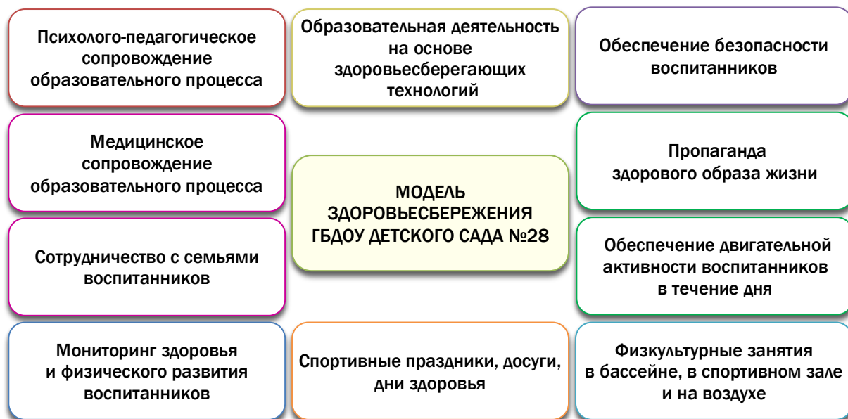
Рис. 5. Модель здоровьесбережения ГБДОУ детского сада № 28 Приморского района Санкт-Петербурга

Здоровьесберегающая среда ГБДОУ - это комплекс социально-гигиенических, психолого-педагогических, морально-этических, физкультурно-оздоровительных, образовательных системных мер, обеспечивающих ребенку психическое и физическое благополучие, комфортную эмоциональную и бытовую среду в детском саду, повышающих социальную адаптированность дошкольников (см. рис. 5).