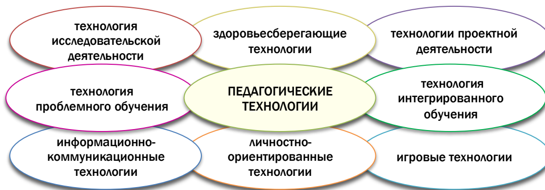
Рис. 6. Педагогические технологии, используемые в образовательном процессе ГБДОУ.

Педагогические технологии, используемые в образовательном процессе ГБДОУ в первую очередь ориентированы на развитие личности ребенка, на раскрытие его творческого потенциала (см. рис. 6.).