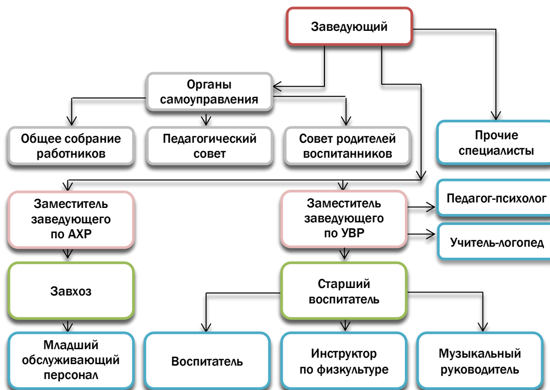
Рис. 2. Организационная структура управления ГБДОУ

В организационную структуру административного управления ДОУ входят несколько уровней линейного управления (Рис. 2.).