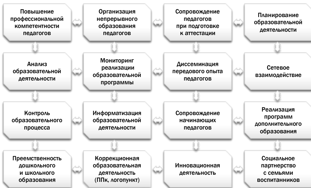
Рис. 1. Система методической работы в ГБДОУ детском саду № 28

Библиотечный фонд ГБДОУ располагается в методическом кабинете, кабинетах специалистов, группах ГБДОУ. Библиотечный фонд представлен методической литературой по всем образовательным областям основной общеобразовательной программы, детской художественной литературой, периодическими изданиями, а также другими информационными ресурсами на различных электронных носителях. В каждой возрастной группе имеется банк необходимых учебно-методических пособий, рекомендованных для планирования воспитательно-образовательной работы в соответствии с Образовательной программой дошкольного образования Государственного бюджетного дошкольного образовательного учреждения детского сада № 28 Приморского района Санкт-Петербурга.