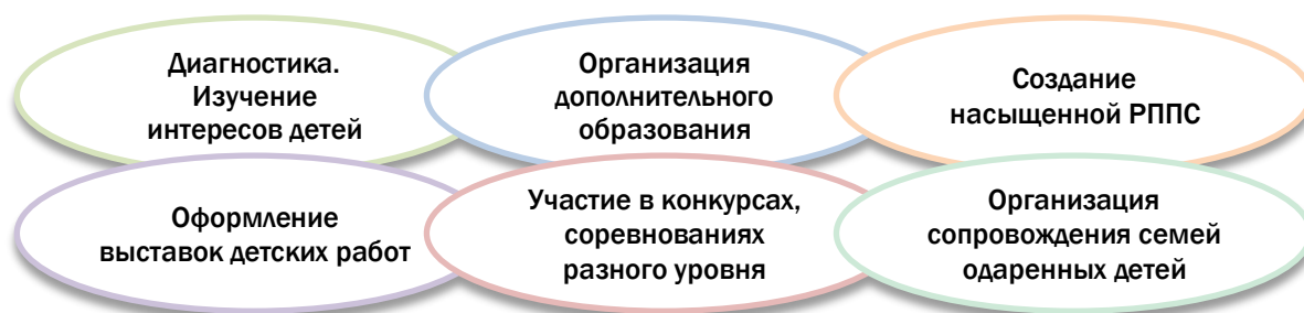
Рис. 7. Содержание работы с одаренными детьми в ГБДОУ.

В целях реализации и развития интеллектуальных и творческих способностей одаренных детей в ГБДОУ проводятся интеллектуальные игры, организуются совместные проекты (см. п.6.5.). Это позволяет увидеть оригинально мыслящих детей, уделять внимание развитию их способностей.