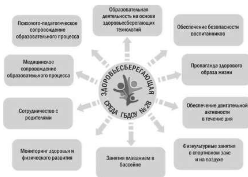
Модель здоровьесбережения ГБДОУ детского сада № 28

В течение 2020 года ГБДОУ систематически проводилась оздоровительная и профилактическая работа посредством моторно-сенсорной коррекции, упражнений, направленных на улучшение функционального состояния организма и общего мышечного тонуса детей (корректирующая гимнастика для укрепления осанки, дыхательная гимнастика, подвижные игры, физкультминутки и пр.).